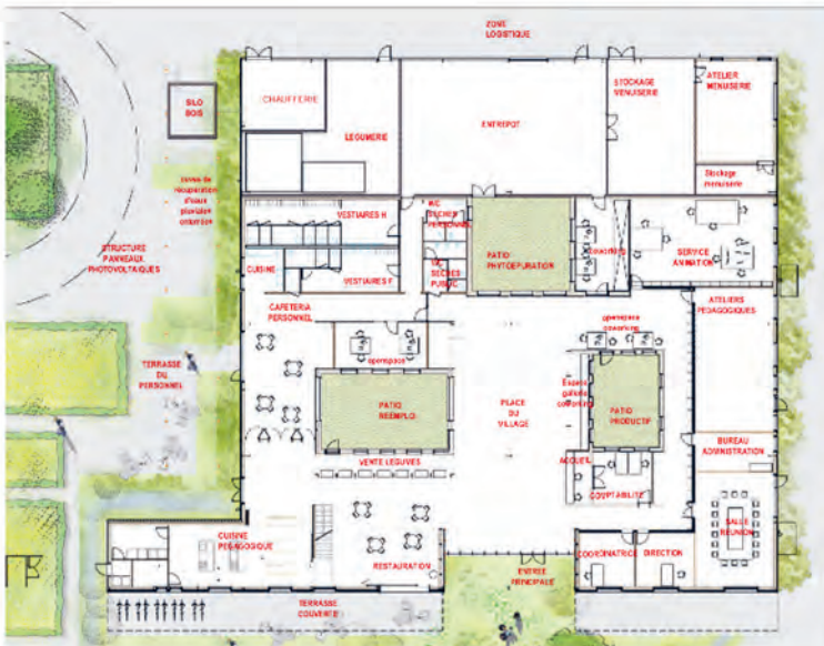
Silo à bois déchiqueté alimentant la chaudière biomasse