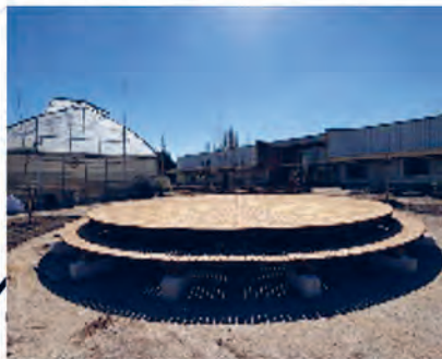
Table de pique-nique / scène