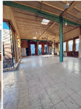
Place du village avec le poêle